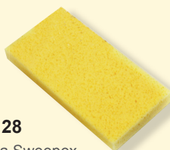
437128 Houba Sweepex