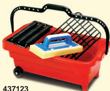
437123 Washboy PVC