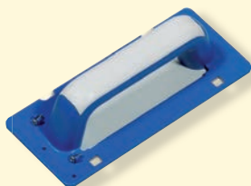
437127 Držák na houbu, plst', roundo