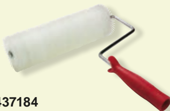
437184 Váleček odvzdušňovací