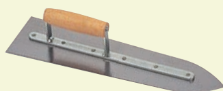
437185 Hladítko šavle