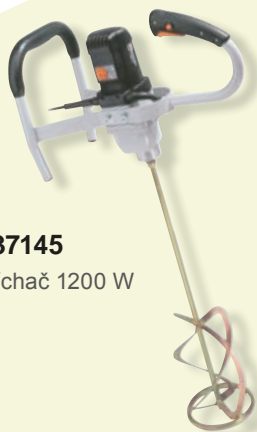
437145 Míchač 1200 W