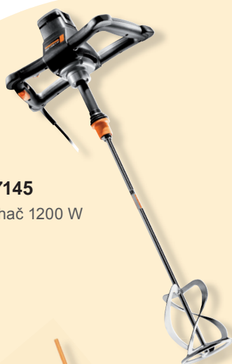
437145 Míchač 1200 W