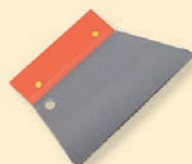
443312 Stěrka ocelová, zub 3 mm