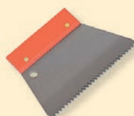
443313 Stěrka ocelová, zub 6 mm