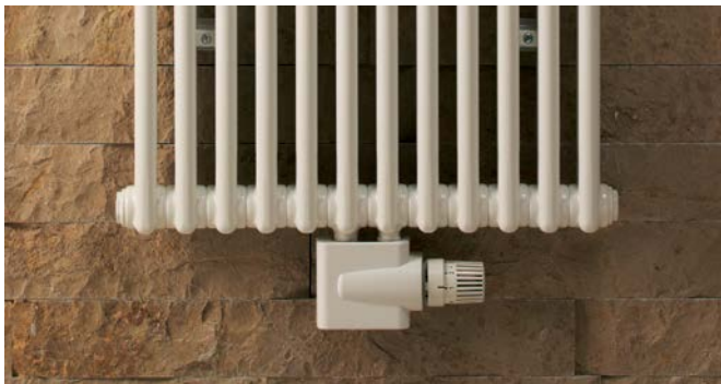
Připojovací armatura Zehnder Vario