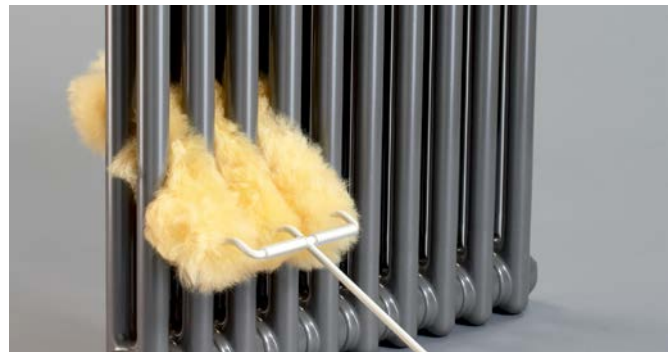
Čisticí kartáč Zehnder z ovčí vlny

H = stavební výška, L = stavební délka, L B = délka držáku na ručník